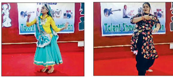
फतेहाबाद। बीएड कॉलेज में टेलेंट सर्च प्रतियोगिताओं में भाग लेते विद्यार्थी।

एमएम कॉलेज ऑफ एजुकेशन फतेहाबाद में दो दिवसीय टेलेंट सर्च प्रतियोगिताओं का आयोजन किया गया। इस दौरान कॉलेज में विभिन्न तरह की गतिविधियां आयोजित की गईं। डांस, सिंगिंग, स्पीच कम्पिटिशन, ऑन स्पॉट पेन्टिंग, फोटो ग्राफी, वीडियो ग्राफी, क्विज, कॉर्टनिंग आदि प्रतियोगिताओं में कॉलेज के विद्यार्थियों ने उत्साहपूर्वक भाग लिया और अपनी प्रतिभा का प्रदर्शन किया। कार्यक्रम का शुभारंभ बतौर मुख्यअतिथि पहुंची महिला रोग विशेषज्ञ डॉ.