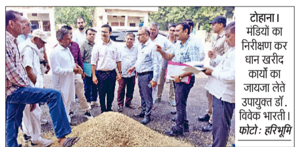
टोहना। मंडियों का निरीक्षण कर धान खरीद कार्यों का जायजा लेते उपायुक्त डॉ. विवेक भारती।

उपायुक्त डॉ. विवेक भारती ने मंगलवार को अनाज मंडियों, धारसूल, जाखल, टोहना और भूना का दौरा कर धान की खरीद को लेकर की गई तैयारियों और व्यवस्थाओं का बारीकी से निरीक्षण किया। इस दौरान उन्होंने किसानों और आर्दितियों से बातचीत कर उनकी समस्याओं को सुना और विश्वास दिलाया कि प्रशासन किसानों को किसी भी स्तर पर असुविधा नहीं होने देगा। डॉ. विवेक भारती ने कहा कि धान फसल की खरीद प्रक्रिया पूरी तरह सुचारु, पारदर्शी और समयबद्ध ढंग से होनी चाहिए।