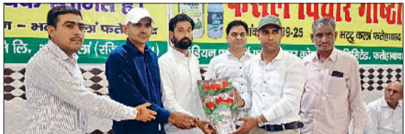
भडूकला। अतिथियों का स्वागत करते हुए।