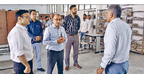
टोहाना। सरकारी कार्यालयों का निरीक्षण कर अधिकारियों को आवश्यक दिशा निर्देश देते उपायुक्त डॉ. विवेक भारती।

उपायुक्त डॉ. विवेक भारती ने मंगलवार को टोहाना लघु सचिवालय, बीडीपीओ कार्यालय टोहाना और जाखल, उपतहसील कार्यालय कुलां व जाखल के विभिन्न कार्यालयों का औचक